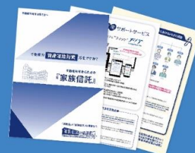
『家族信託の相談窓口』パンフレット