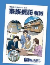
マンガ「家族信託物語」